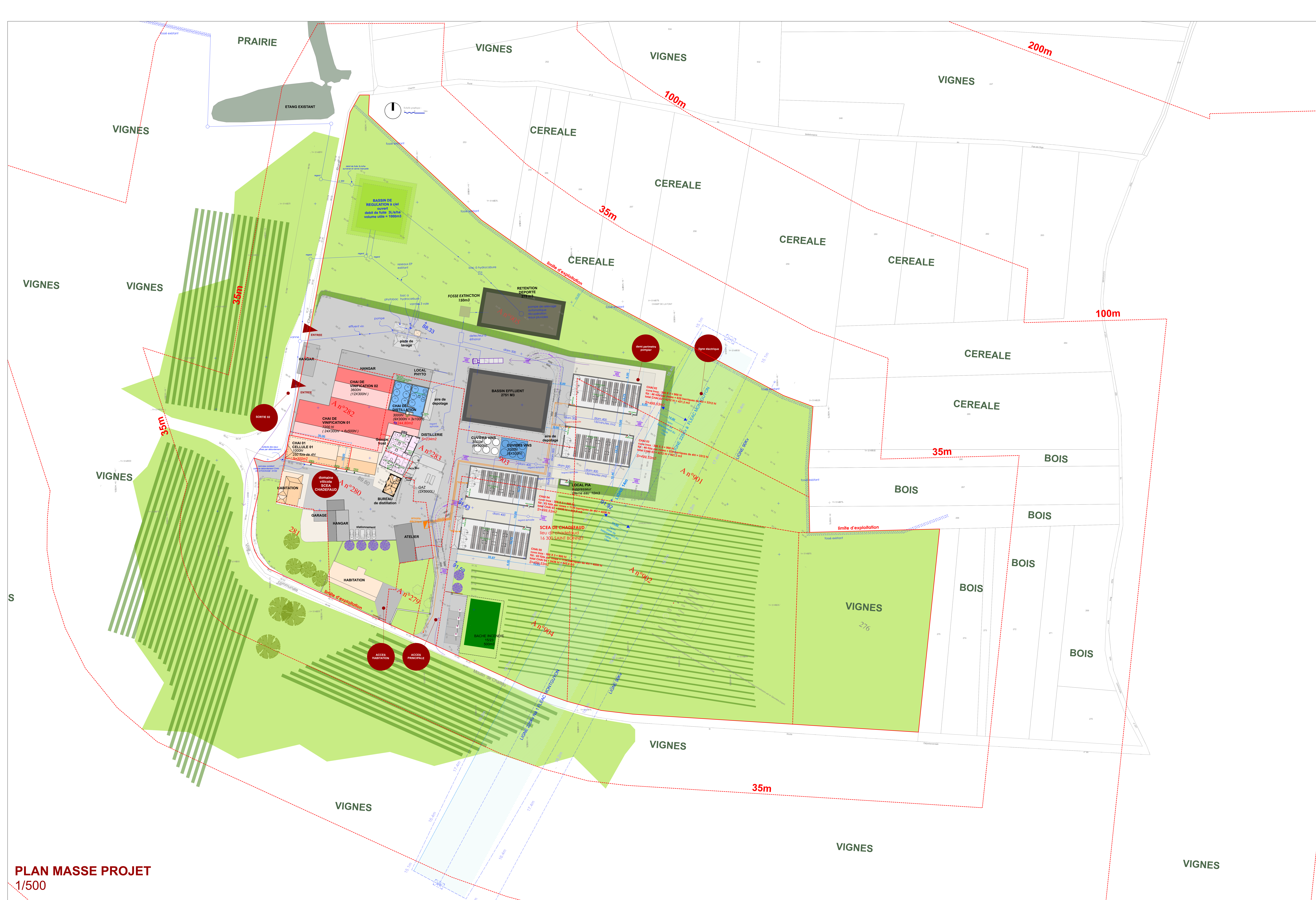
PLAN MASSE PROJET 1/500